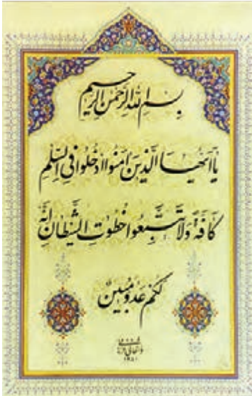
سوره بقره آیه ۲۰۸

هر فردی که قرآن کریم را بخواند و بتواند کلمات قرآن را برای خود ترجمه کند، معانی آیات را متوجه می‌شود، ولی بعضی از آیات را افراد متخصص در قرآن باید توضیح بیشتری بدهند تا ابعاد مختلف آن بیشتر معلوم شود. به کتاب‌هایی که آیات قرآن را ترجمه کرده و درباره آن توضیحات بیشتری مانند، دلائل نزول آن آیه یا سوره، زمان نزول و معانی و مقصود آیات با توجه به سایر آیات و سخنان پیشوایان دین آورده‌اند، کتاب تفسیر قرآن گفته می‌شود. در جهان اسلام تاکنون برای قرآن حدود پانصد تفسیر نوشته شده است که برخی از آن تفاسیر به بیست‌الی سی جلد می‌رسد. یکی از تفاسیر بسیار خوب، تفسیر نمونه نام دارد که با همکاری جمعی از دانشمندان و زیر نظر آیت‌الله مکارم شیرازی در ۲۷ جلد تألیف شده است.